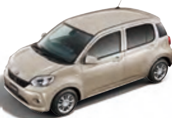
バウダリーペーージュ メタリック