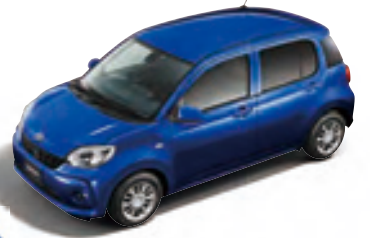
ティンブルー クリスタルマイカ *1