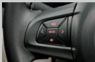
ステアリングスイッチ