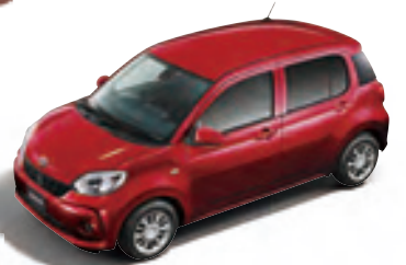
ファイアークォーツ レッドメタリック