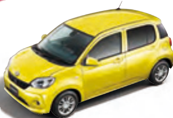
レモンスカッシュ クリスタルメタリック