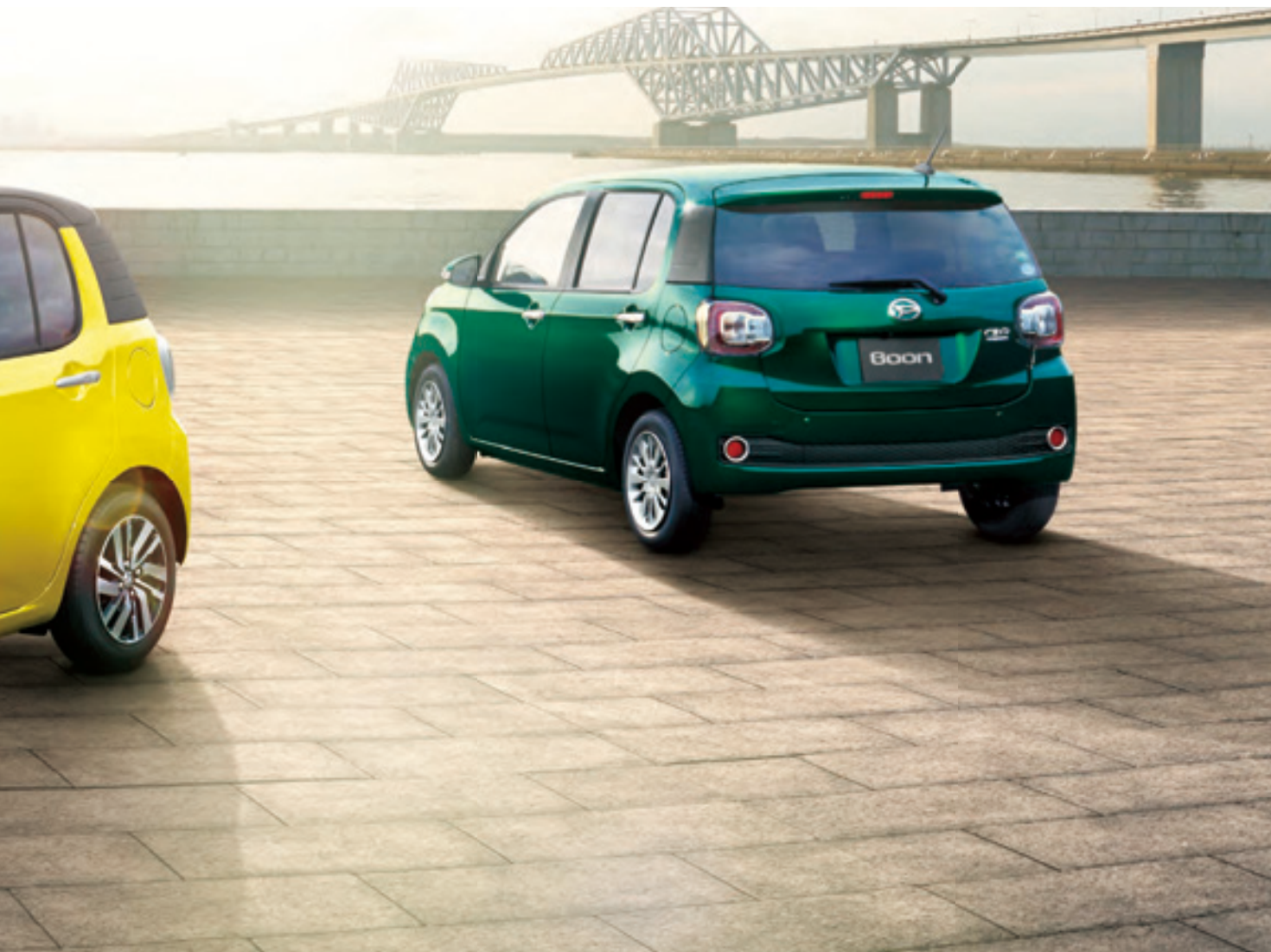
Photo (左) : CILQ*Gパッケージ SA II*(2WD)。ボディカラーのブラックマイカメタリック(X07)×レモンスカッシュクリスタルメタリック(Y13)【XE4】はメーカーオプションで54,000円高(消費税込み)。 Photo (右) : CILQ*SA II*(2WD)。ボディカラーはダークエメラルドマイカ(G58)。純正ナビ装着用アップグレードバックはメーカーオプションで29,160円高(消費税込み)。