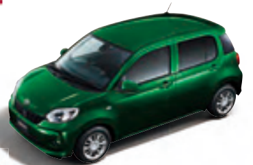
ダークエメラルド マイカ