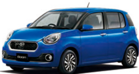
Photo: CILQ*Gパッケージ SA II*(2WD)。ボディカラーのディープブルークリスタルマイカ(B79)はメーカーオプションで32,400円高(消費税込み)。