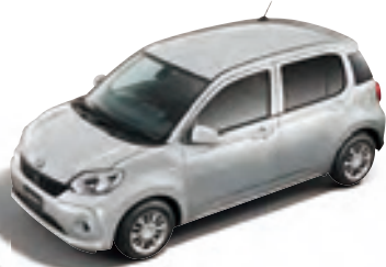
ブライツシルバー メタリック