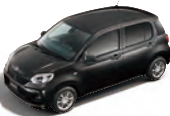
ブラックマイカ メタリック