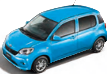
ファインブルー マイカメタリック