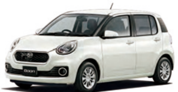
Photo: CILQ*SA II*(2WD)。ボディカラーのパールホワイトⅢ(W24)はメーカーオプションで32,400円高(消費税込み)。

*1. 燃料消費率は定められた試験条件での値です。お客様の使用環境(気象、渋滞等)や運転方法(急発進、エアコン使用等)に応じて燃料消費率は異なります。