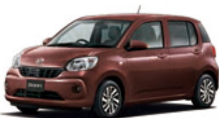
Photo: X"Gパッケージ SA II" (2WD)。ボディカラーのプラムブラウンクリスタルマイカ (R59) はメーカーオプションで32,400円高 (消費税込み)。