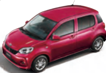
マゼンタベリー マイカメタリック