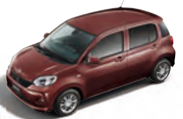
ブラムブラウン クリスタルマイカ *1